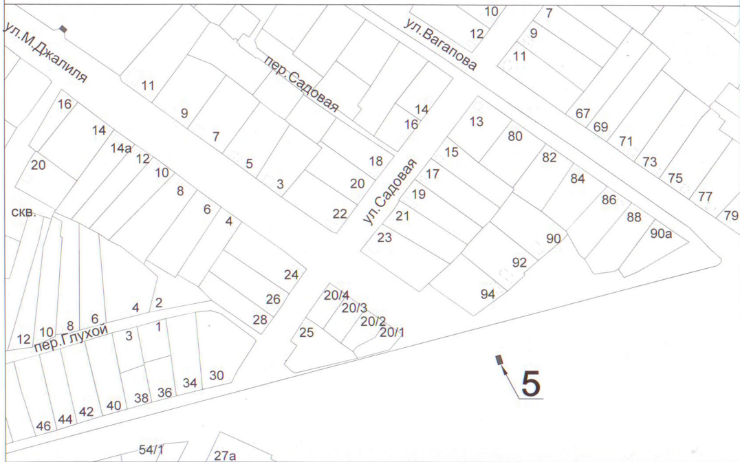
Схема расположения Л. №5