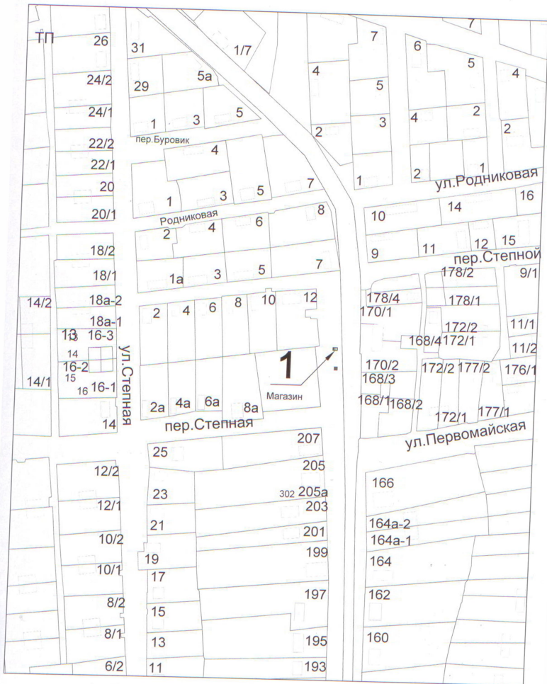
Схема расположения Л. №1